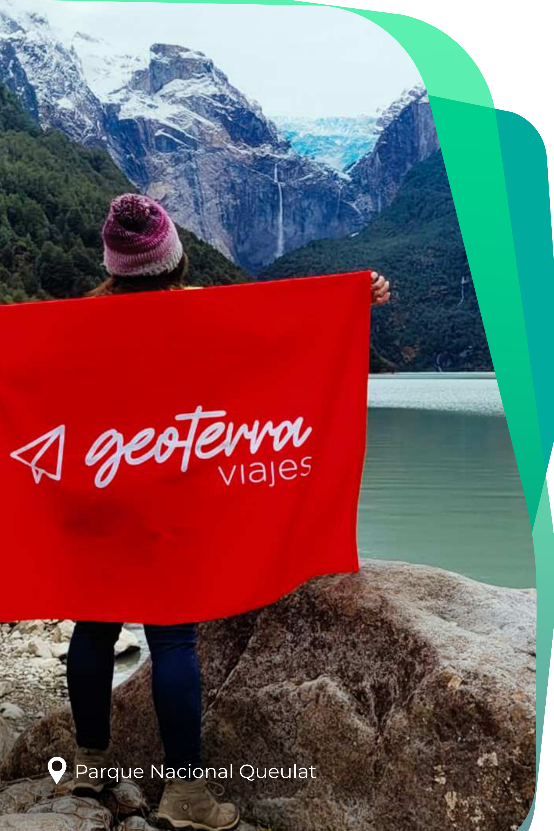
📍 Parque Nacional Queulat