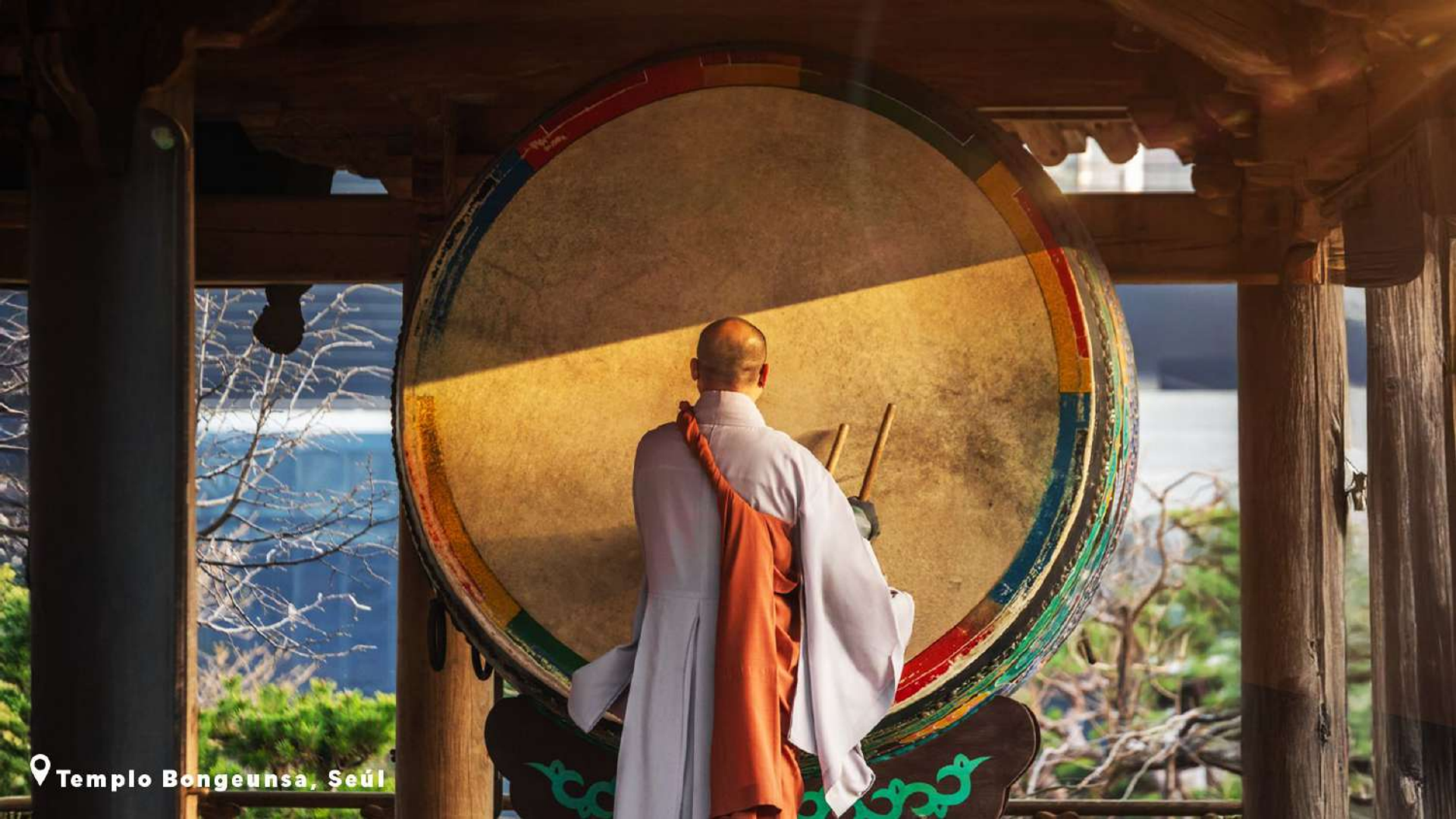
📍 Templo Bongeuksa, Seúl