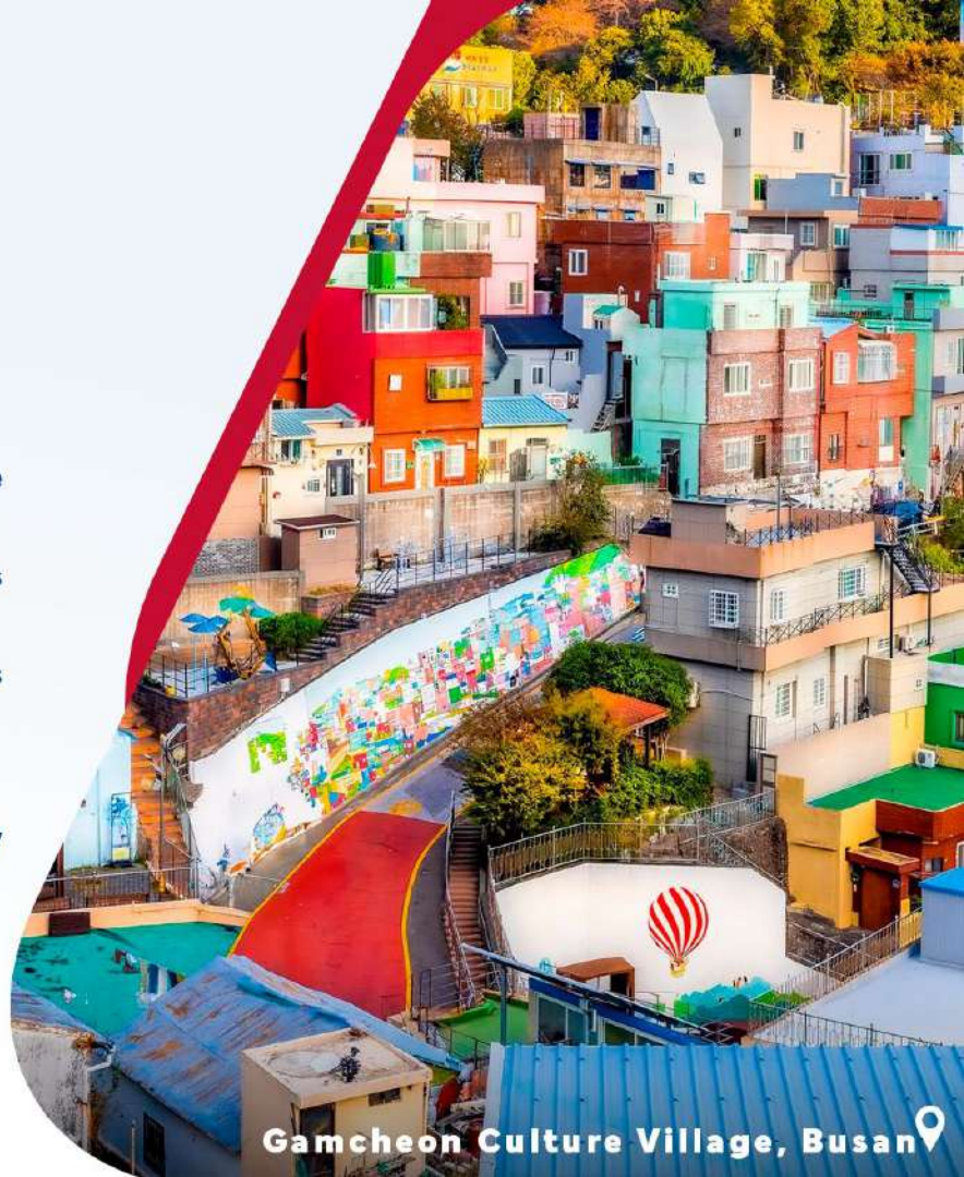
Gamcheon Culture Village, Busan

Desayuno y cena incluidos. Almuerzo por cuenta propia.