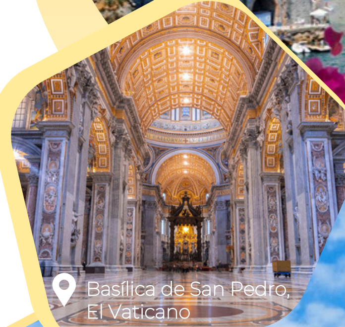
Basílica de San Pedro, El Vaticano