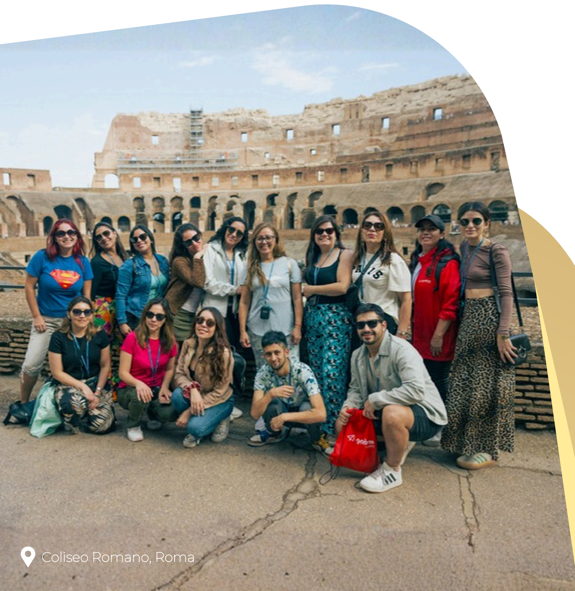
Coliseo Romano, Roma