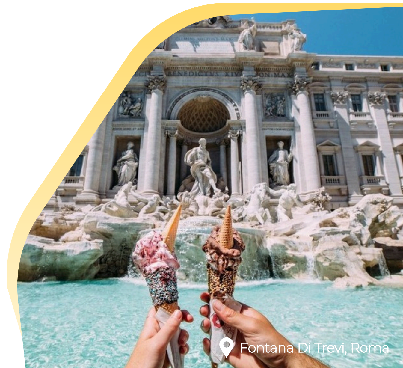
Fontana Di Trevi, Roma