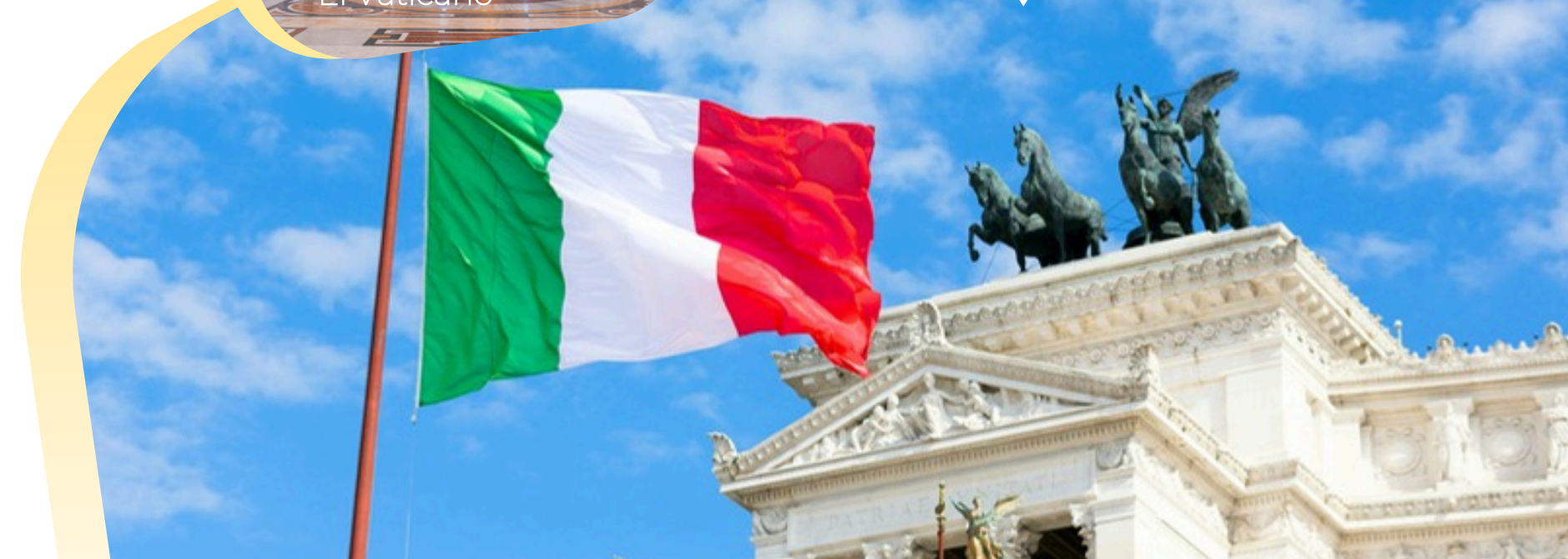
Altar de la Patria, Roma